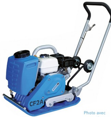
Photo avec accessoires