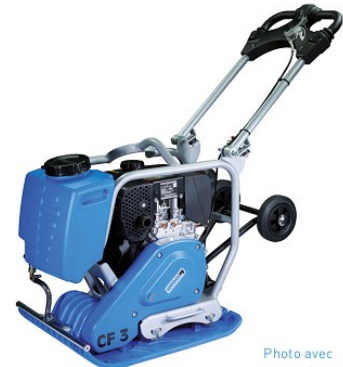
Photo avec accessoires